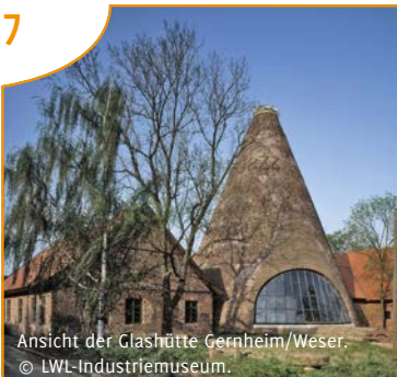
Ansicht der Glashütte Gernheim/Weser.

Kosten: 7 € (Mitglieder NGH & Heimatbund Gehrden), 10 € (Nichtmitglieder).